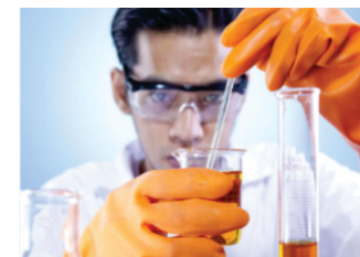
Simulação, Otimização e Controle de Processos