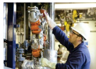
Dimensionamento e Seleção de Equipamentos