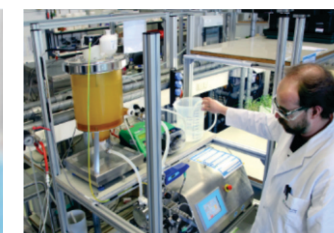
Análise e Catalogação de produtos químicos

16 3351-8111 | eqjr.ufscar@gmail.com | www.eqjunior.com.br