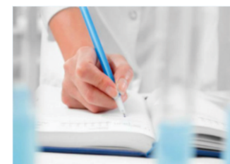
Controle ambiental e tratamento de efluentes