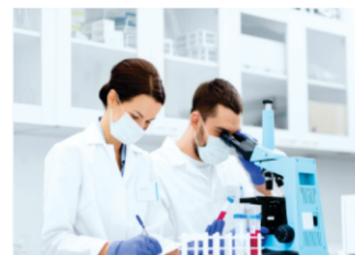
Síntese e Projeto de Processos Químicos

A EQ Júnior (sem fins lucrativos) é gerida pelos alunos de graduação do curso de engenharia química da Universidade Federal de São Carlos (UFSCar). Atua no mercado desde 2009 desenvolvendo projetos para indústrias de todo porte no ramo da química e mineração, ganhando reconhecimento nas esferas: empresarial e acadêmica. Trabalhamos com os melhores métodos, visando a solução para sua empresa, oferecendo o melhor em nossos serviços, satisfazendo suas expectativas com qualidade e eficiência. Contamos com membros da graduação, professor tutor e todo o conhecimento que um dos melhores cursos de Engenharia Química do Brasil pode oferecer.